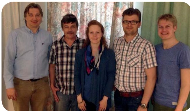
Styrelsen efter årsmöte