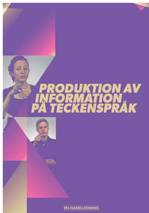
Senaste broschyr som skapades av projekt Accola

Vykort med handalfabetet delades ut på olika platser där föreningen deltagit i arrangemang och även i samarbete med andra. Under året tog vykortet slut och en ny omgång har tryckts upp. De är mycket populära.