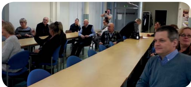
Projekt Accola gästar hos Raision Seudun Viittomakieliset ry