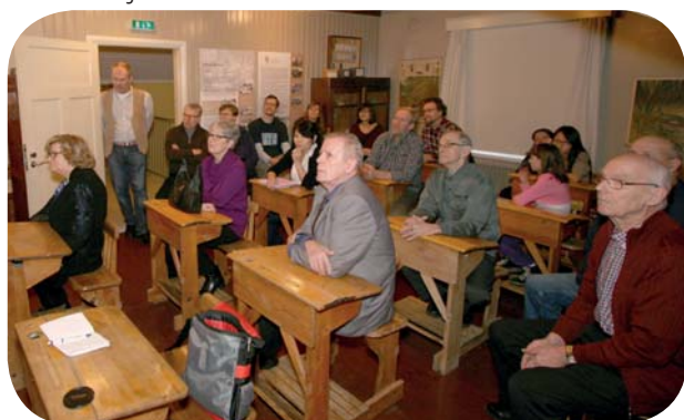
Trettonde dag fest

En allmän träff ordnades i en lokal av Finlandssvenska teckenspråkigas förening den 25 januari, där fanns 11 medlemmar.