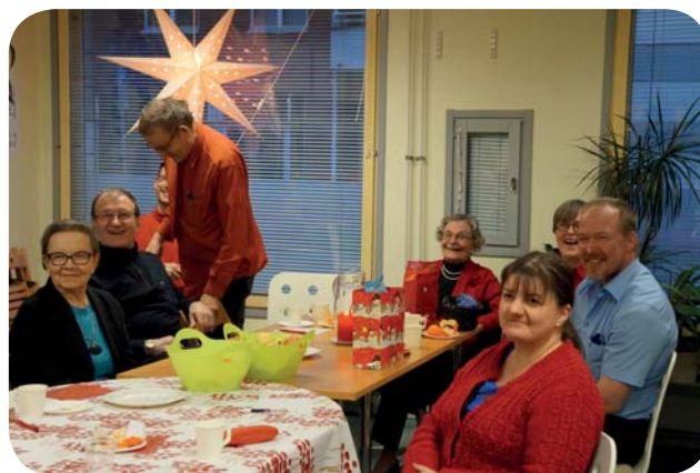
Glada medlemmar under lilla julfest på lucia dagen

på eget språk, när vi fick roliga berättelser och också om döva karelare - en kort föreläsning av Outi Ahonen. På festen hade vi lite över 10 gäster. Efter festen ordnades det teckenspråkig gudstjänst i Tammerfors Gamla kyrkan vid centrumtorget.