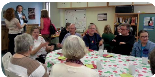
Medlemsträff i september

Grillträffen hölls i Alskathemmet i Korsholm lördagen den 9 augusti. Vi hade ett bra och skönt väder, när vi trivdes att träffa österbottniska teckenspråkiga efter sommaren och grillade mat med grekisk sallad. Där fanns 14 sommargäster.