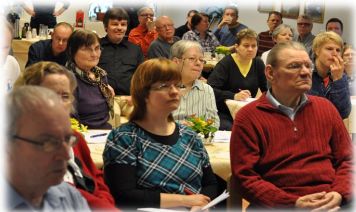
Medlemmar är aktiv på årsmötets diskussioner