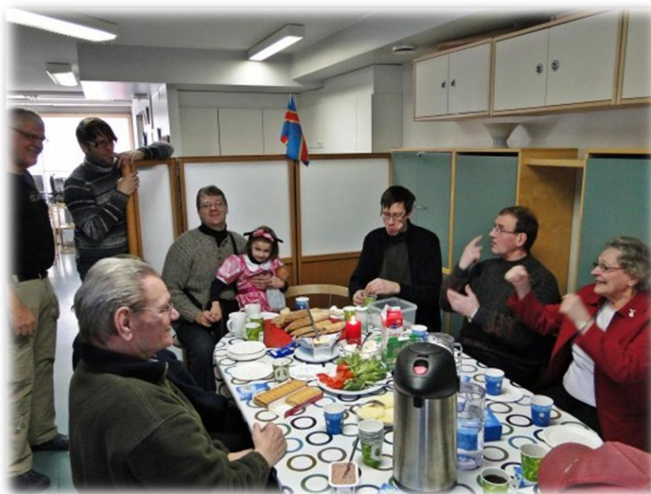
Svenska allmänna träff i kansliet, Tilkkgatan 7, Helsingfors

Föreningen arrangerar regelbundet medlemsträffar utöver andra program där döva medlemmar deltar (se nedan). Under året har de hållits 8 gånger. Man har haft information, diskussioner om aktuella ämnen och socialt samkväm med kaffeservering. Medlemsträffar har skett mest på föreningens kansli, Tilkkgatan 7 i Helsingfors.