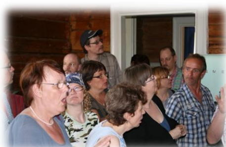
Alla deltagare är f d elever i dövskolan i Borgå, nu bosatta i Sverige och Finland