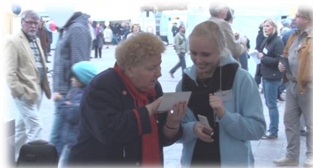
Undervisning i handalfabetet